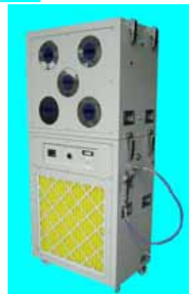
蛍光灯無しでも使用可能 重量 : 約72kg