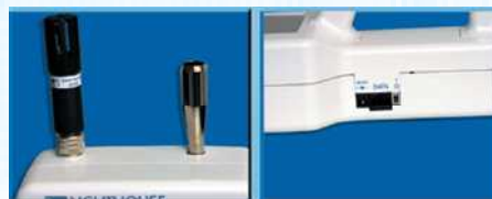
温湿度プローブ / 吸引口